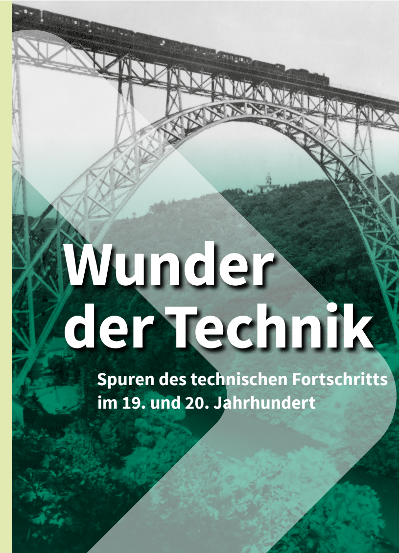
Titelfoto: Müngstener Brücke mit Dampfzug, 1930–1960