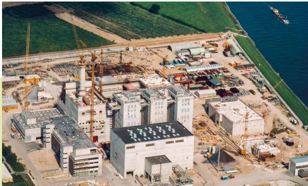
Schrägluftbild Kernkraftwerk Kalkar