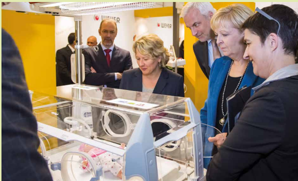
Düsseldorf: Rundgang auf der Messe „Medica“ durch Ministerpräsidentin Hannelore Kraft und die Ministerinnen und Minister Barbara Steffens, Svenja Schulze und Garrelt Duin, 12. November 2014 Foto: Landespresse- und Informationsamt (LAV NRW RWB 42029 Nr. 5)