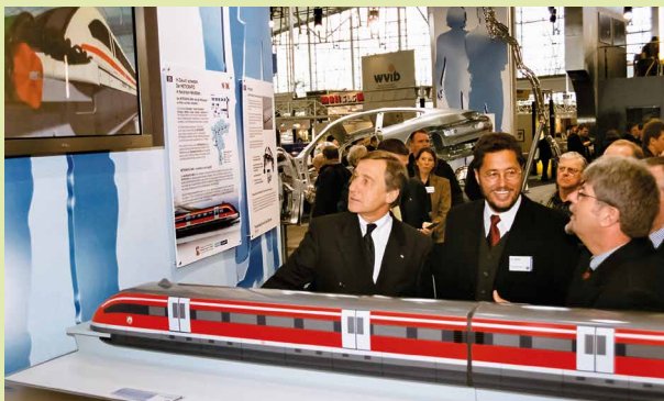
Ministerpräsident Wolfgang Clement und Wirtschaftsminister Ernst Schwanhold auf der Hannover Messe beim Besuch des Metrorapid-Standes, 18. April 2002