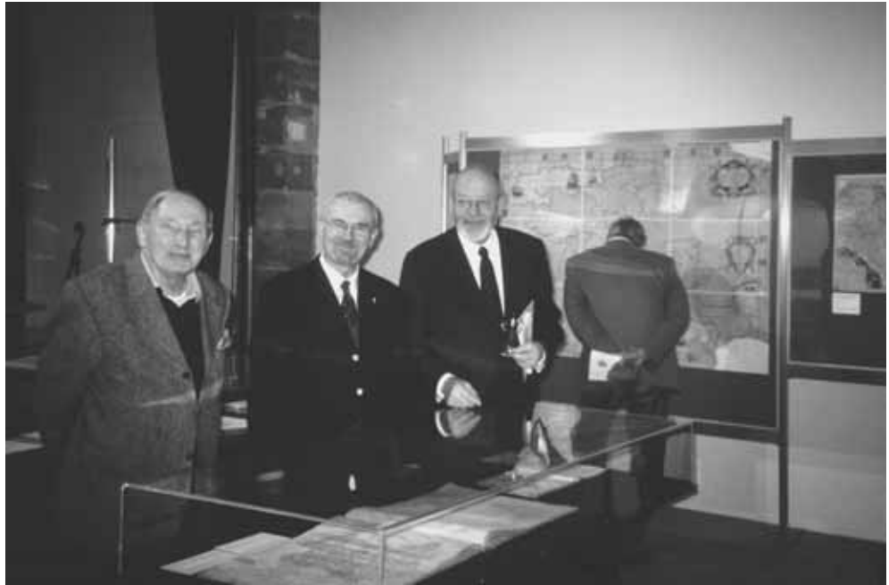
Ausstellungsbesucher im Goethe-Institut Lyon

durch französische Karten und Atlanten als wesentliches Desiderat. Die Karten zeigen nämlich nicht nur die historischen Veränderungen der deutsch-französischen Grenze auf, sondern vermitteln auch einen repräsentativen Eindruck von der tendenziösen Darstellung der Grenzgebiete – die deutsche Perspektive verlangte also nach einer entsprechenden französischen Sicht. Den Straßburger Kolleginnen und Kollegen gelang es, die Ausstellung um einschlägige Stücke aus Straßburger Beständen zu ergänzen, so dass damit die synchrone Perspektive ermöglicht wurde. Die deutschen wie die französischen Schulatlanten machen die Abhängigkeit der Kartenbilder von den zeitgenössischen politischen Zuständen deutlich. Ihre pädagogische Absicht lässt das über Jahrhunderte gespannte deutsch-französische Verhältnis eindringlich nachvollziehen, ebenso wie die nach dem Zweiten Weltkrieg begründete besondere Freundschaft der beiden Nachbarn.