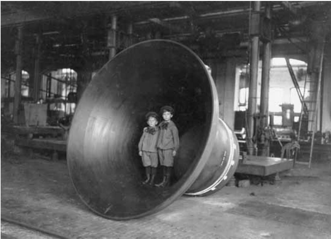
Ein Beispiel aus der Fotosammlung: Gussstahlglocke für die Georgenkirche in Berlin, Hersteller: Bochumer Verein für Bergbau und Gussstahlfabrikation, 1898

kennbar. Quantitativ liegen sie in den Jahren nach 1950, qualitativ in der Zeit vor 1914. 19 Insgesamt liegen im Historischen Archiv Krupp mittlerweile knapp zwei Millionen Aufnahmen, und zwar in fast allen denkbaren Formen: Positivabzüge, Kontaktabzüge, Glasplatten, Dias, Filmstreifen usw.