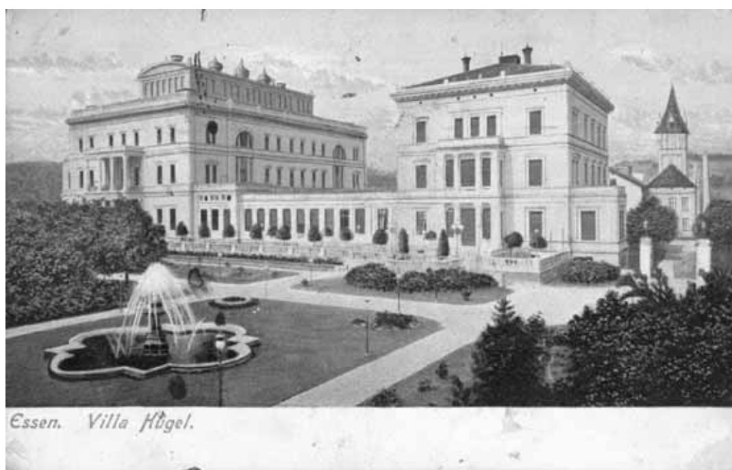
Postkarte der Villa Hügel in Essen, um 1900. Hier entsteht das Krupp'sche Familienarchiv.