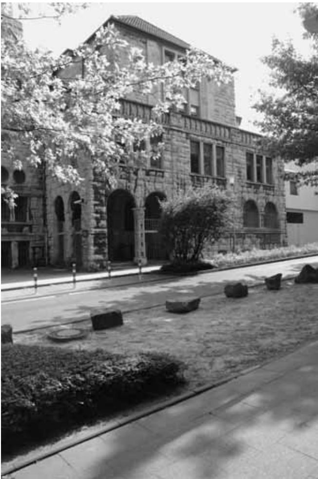
Rabbinerhaus: Das Stadtarchiv Essen ist seit 1961 im ehemaligen Rabbinerhaus der Alten Synagoge untergebracht

Als Hermann Schröter das Essener Stadtarchiv anlässlich des 38. Deutschen Archivtages, der vom 26. bis zum 29. September 1960 in der Ruhrmetropole stattfand, vorstellte, da plagten ihn gewaltige Raumprobleme. Der stetig wachsende Bestand – 1960 umfasste er 2500 Regalmeter – ließ sich nicht länger im Rathaus unterbringen. Doch Schröter war guter Dinge. „Dank des Verständnisses der verantwortlichen Stellen“ sollte bald eine Lösung gefunden werden. 1 Als neues Domizil diente das ehemalige Rabbinerhaus in der von den Nazis gebrandschatzten Alten Synagoge, die die Stadt käuflich erworben hatte.