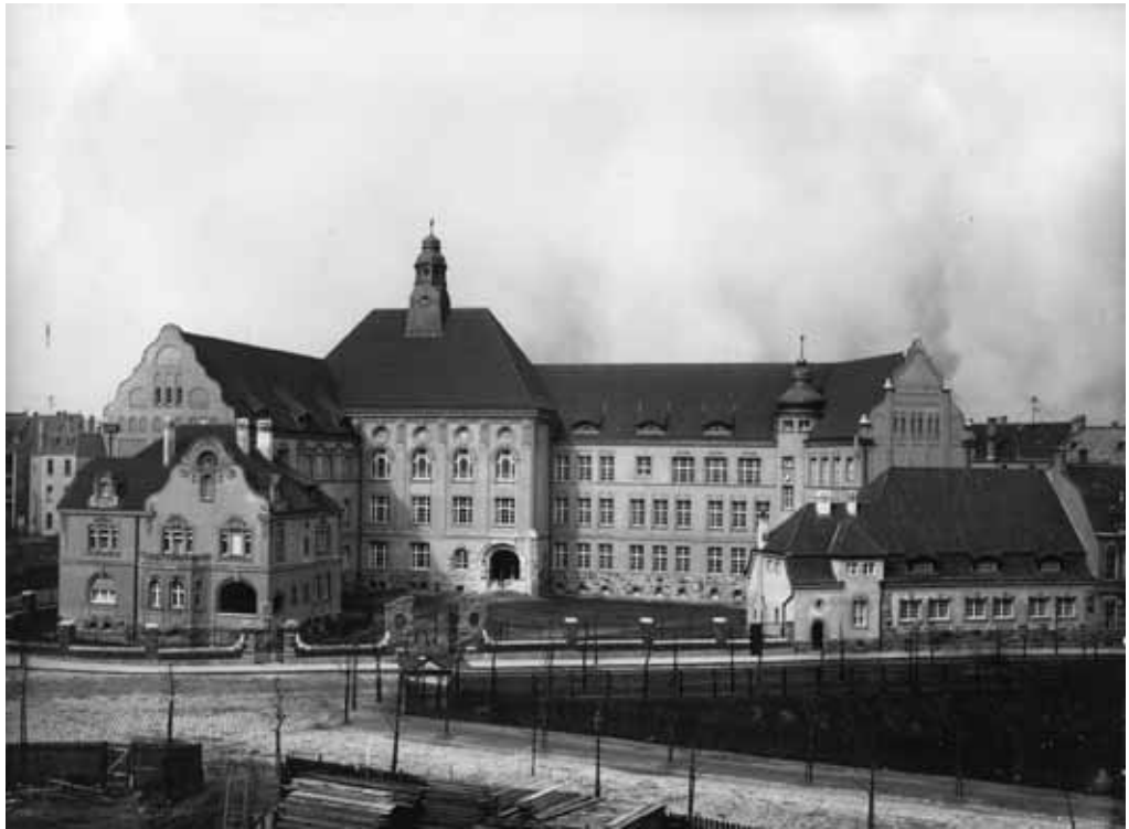
Die 1906 erbaute Luisenschule am Bismarckplatz wird der Standort für das zukünftige „Haus der Essener Geschichte“ sein

tenden Beständen, die bis ins 13. Jahrhundert zurückreichen,