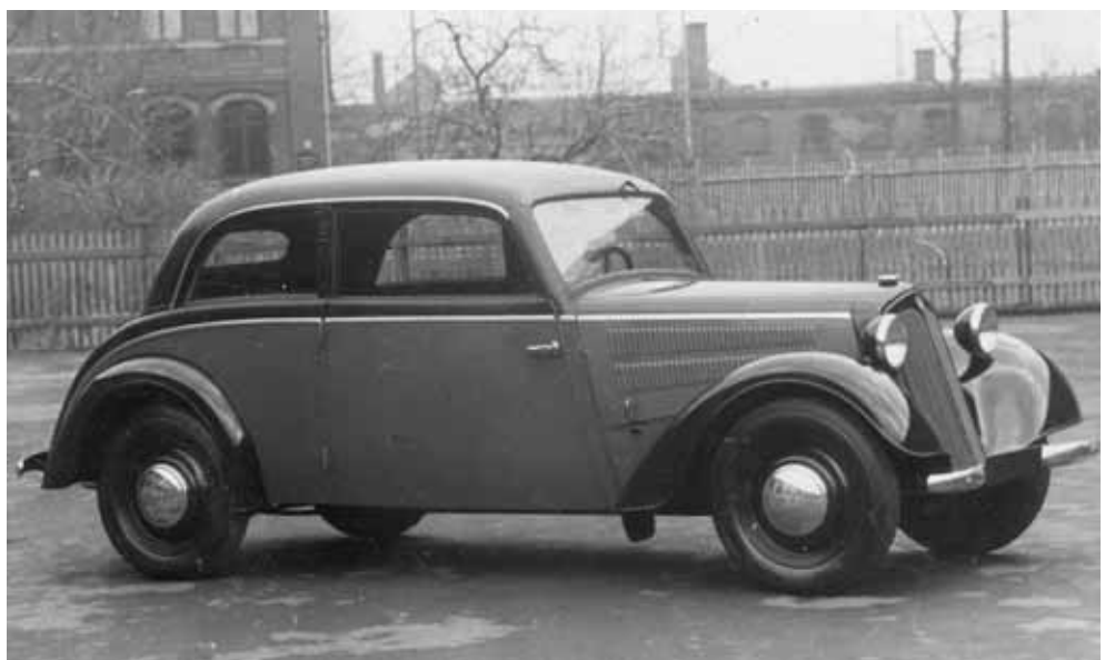
DKW/IFA F 8; VEB Audi-Werke Zwickau; Produktionsbeginn 1949

Im zweiten Zeitabschnitt wird auf der Tafel „DDR-Neuentwicklungen“ zunächst auf den PKW P 70 verwiesen. Dieser Kleinwagen, der in der ersten Hälfte der 1950er Jahre entwickelt wurde, ging 1955 in die Fertigung. Die wichtigste Neuerung an diesem Auto war eine Kunststoff-Karosserie. Der P 70 war damit der erste deutsche Gebrauchswagen mit einer derartigen Ausstattung. Parallel zur Fertigung des P 70 begann die Entwicklung des P 50. Dieser Kleinwagen, der erst später die Bezeichnung „Trabant“ erhielt, war die erste komplette „DDR-eigene“ Entwicklung eines PKW. Von dieser „DDR-Legende auf Rädern“ wurden über drei Millionen Stück gefertigt. Die Zwickauer Konstrukteure betrachteten dieses Auto, Anfang der 1960er Jahre zum Trabant 601 weiterentwi-