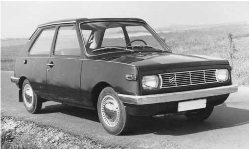
Prototyp des P 603; VEB Sachsenring Automobilwerke Zwickau; 1967

ckelt, als Interimslösung. Letztlich wurde dieses als Übergangsmodell konzipierte Fahrzeug jedoch bis Mai 1990 produziert.