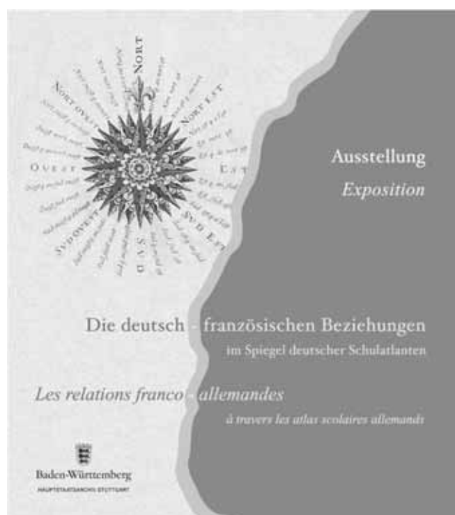
Ausstellungsmotiv (Entwurf: Katharina Schmid, Kirchheim unter Teck)

Vermittelt durch das Ministerium für Wissenschaft, Forschung und Kunst in Baden-Württemberg wurde der