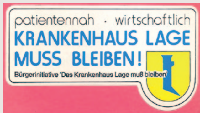
Aufkleber der Bürgerinitiative „Das Krankenhaus Lage muss bleiben“, 1980

Tel.: 0 52 32 / 60 14 71 | E-Mail: stadtarchiv@lage.de