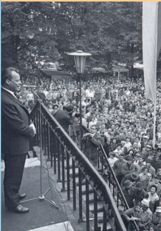
Willy Brandt als Wahlkampfredner 1966