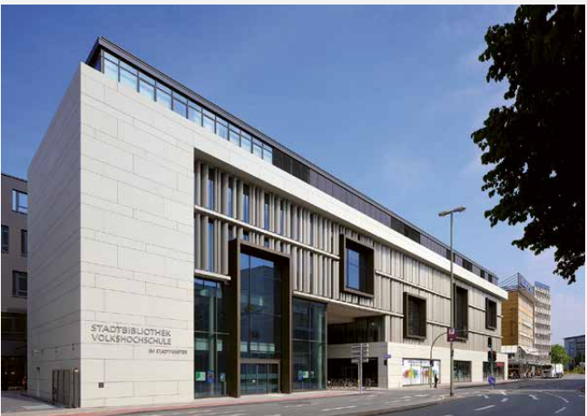
Duisburger Stadtfenster mit der Zentrale der Stadtbibliothek und der Volkshochschule

Abbildung Vorderseite: Text „Mietstreik“ aus der Broschüre „Guten Morgen“ der Band „Ton Steine Scherben“, afas, 82 II. 1972:5