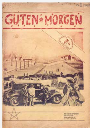
Titelseite der Broschüre „Guten Morgen“, afas, 82 II 1972:5

In der Veranstaltungsreihe und der Ausstellung wird den unterschiedlichsten Formen von Literatur vom 19. Jahrhundert bis in die Gegenwart nachgegangen, vom handgeschriebenen Tagebuch bis zum modernen Poetry-Slam. Eröffnet wird am Tag des offenen Denkmals mit Rezitationen aus archivischen Unterlagen, darunter die Kurzgeschichte „Mit dem Lesen fängt's an“ des Schriftstellers und Bibliothekars Hansjürgen Bulkowski, der mehrere Förderstipendien des Landes Nordrhein-Westfalen erhalten und so einen Niederschlag in der Überlieferung des Landesarchivs gefunden hat. Das Duisburger Archiv für alternatives Schrifttum steuert zu der Lesung Texte aus der 1972 erschienenen Broschüre „Guten Morgen“ der legendären Berliner Polit-Rockband „Ton Steine Scherben“ bei; dabei ist ein Thema wie „Mietstreik“ noch heute von großer Aktualität. Im Rahmenprogramm gestaltet u. a. das Stadtarchiv Duisburg ge-