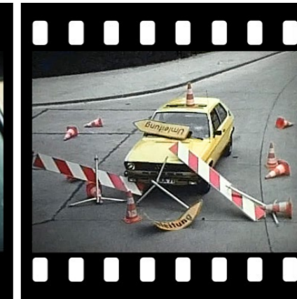
Ausschnitte aus der Filmreihe „Herz ist Trumpf“, 1970er Jahre, LAV NRW R RWF 01431_0001

Anhand des Filmes lässt sich herausarbeiten, wie dieses Medium ab den 1970er Jahren für die Verkehrserziehung eingesetzt wurde [siehe Abb. oben]. In kurzen Geschichten, die im Fernsehen oder auch im Kino liefen oder in der Schule im Verkehrsunterricht gezeigt wurden, werden oft auf unterhaltsame Art einzelne Themen der Verkehrssicherheit behandelt. Ein zeittypisches Beispiel hierfür sind die Spots mit Dieter Hallervorden („Didi“) der Reihe „Herz ist Trumpf“, die damals im Auftrag des Ministeriums für Wirtschaft, Mittelstand und Verkehr NRW herausgegeben wurden. In jeder der etwa drei bis vier Minuten langen Folgen wird ein Aspekt des Straßenverkehrs thematisiert, z. B. Vorfahrt, Rücksicht auf Fußgänger und Radfahrer und Ähnliches. Unterlegt mit „flotter“ Musik und gekennzeichnet durch den typischen Klamauk des Komi-