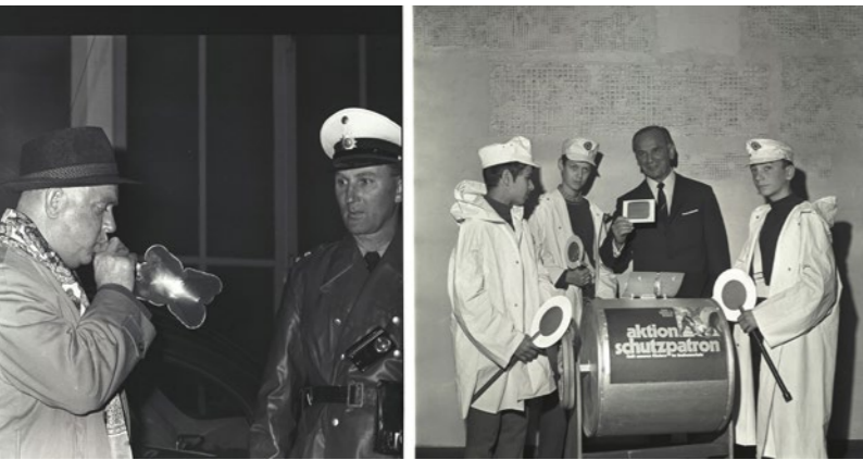
Alkoholttest in den 1950er Jahren

483.01.00) ein Film mit der Signatur LAV NRW R, RWF 01431_0001 [5_9_abb_04]. Und auch in der Plakatsammlung kann man fündig werden. Mit der Signatur LAV NRW R, DPA_0090_0135 [5_9_abb_05] kann z. B. ein Wahlplakat der CDU von 1990 bestellt werden, das die Verkehrssicherheit als politisches Thema aufgreift.