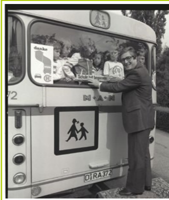
LAV NRW R RWB 11797_0004

In dem Findbuch 480.01.00 zum Sammelbestand Fotografien sind zu diesem Thema z. B. die Fotos mit den Signaturen LAV NRW R, RWB 04511_0003 [5_9_abb_02], LAV NRW R, RWB 09473_0005 [5_9_abb_03] und LAV NRW R, RWB 01714_0002 [5_9_abb_01] verzeichnet. Insbesondere Filme wurden seit den 1970er Jahren besonders häufig für die Verkehrserziehung eingesetzt. Entsprechend findet sich im Sammelbestand Filme und Video (Findbuch