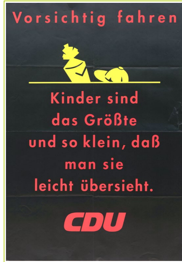
Plakat der CDU 1990, LAV NRW R DPA_0090_0135

» Findbuch 330.08.00 „Kultusministerium NRW, Volks- Mittel- und Hilfsschulen“ (Bestand NW 0020)