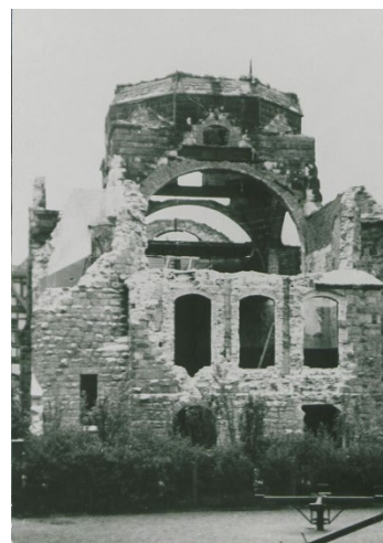
Abbildungen: LAV NRW OWL D 75 Nr. 2059, D 75 Nr.1125 sowie D 75 Nr. 5267