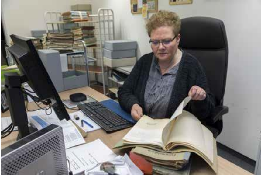
Die Verzeichnung übernommener Unterlagen ist die Voraussetzung für die Nutzung.

Was passiert mit dem Schriftgut, das übernommen wird? Damit Archivgut genutzt werden kann, muss es erfasst und auf seinen Informationsgehalt hin verzeichnet werden, d.h. es werden wesentliche Eigenschaften registriert. Nur so ist das einzelne Stück wieder auffindbar und auswertbar. Ohne diese archivische Kernaufgabe wäre das verwahrte Gut nur eine chaotische und wertlose Ansammlung von Material.