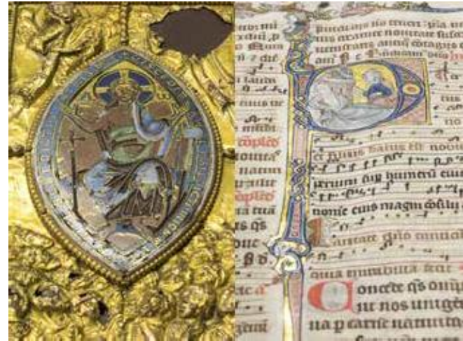
Deckel und Innenseite eines mittelalterlichen Codex

Das LAV NRW besteht in seiner jetzigen Form seit dem 1. Januar 2004. Durch den Errichtungserlass vom 14. November 2003 wurde aus den vormaligen einzelnen Staatsarchiven ein LAV NRW. Derzeit besteht das LAV NRW aus drei Standorten, wobei die jeweiligen Abteilungen für bestimmte regionale Bereiche zuständig sind: Duisburg mit der Abteilung Rheinland, Münster mit