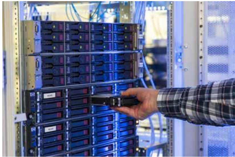
Archivierung elektronischer Unterlagen

Aktuell befindet sich die Verwaltung hinsichtlich der Schriftgutverwaltung im Wandel. Im Rahmen des E-Government-Gesetzes haben manche Behörden bereits die elektronische Akte eingeführt, befinden sich im Umstellungsprozess oder beabsichtigen diesen Schritt in naher Zukunft. Darüber hinaus findet zur Unterstützung der Geschäftsprozesse in vielen Bereichen seit Jahrzehnten eine Vielzahl elektronischer Hilfen Anwendung: Von der E-Akte, über Office-Anwendungen, Fileablagen bis zu spezifischen Fachverfahren. Sie alle ersetzen zunehmend analoge Bearbeitungsschritte. Die im Archivgesetz NRW festgelegte, grundsätzliche Anbietungspflicht erstreckt sich auch auf diese elektronischen Unterlagen in jeglicher Form. Auch wenn die rechtsverbindliche Aktenführung bei Ihnen noch auf der Papierakte beruht, sind beispielsweise verwendete Fachverfahren anzubieten.