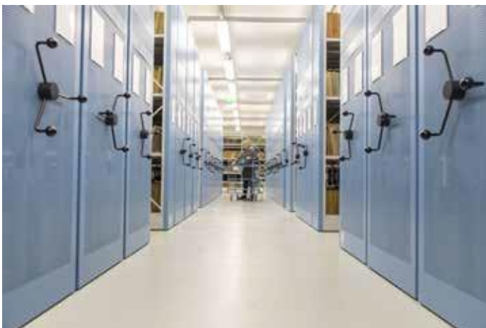
Blick in einen unserer modernen Magazinräume.

Dabei erfolgt die Nutzung im Rahmen gesetzlicher Vorgaben des Archivgesetzes NRW, die den Zugang zu Archivgut transparent regeln. Sie dienen einerseits dazu, mit Schutzfristen sensible Daten Betroffener zu wahren und andererseits mit bestimmten Auflagen den Erhalt der Unterlagen zu sichern. Damit ist auch die weitere Kernaufgabe des LAV NRW angesprochen, nämlich der dauerhafte Erhalt des Archivgutes – möglichst auf ewig. Um diesen Auftrag zu erfüllen, muss das Archivgut