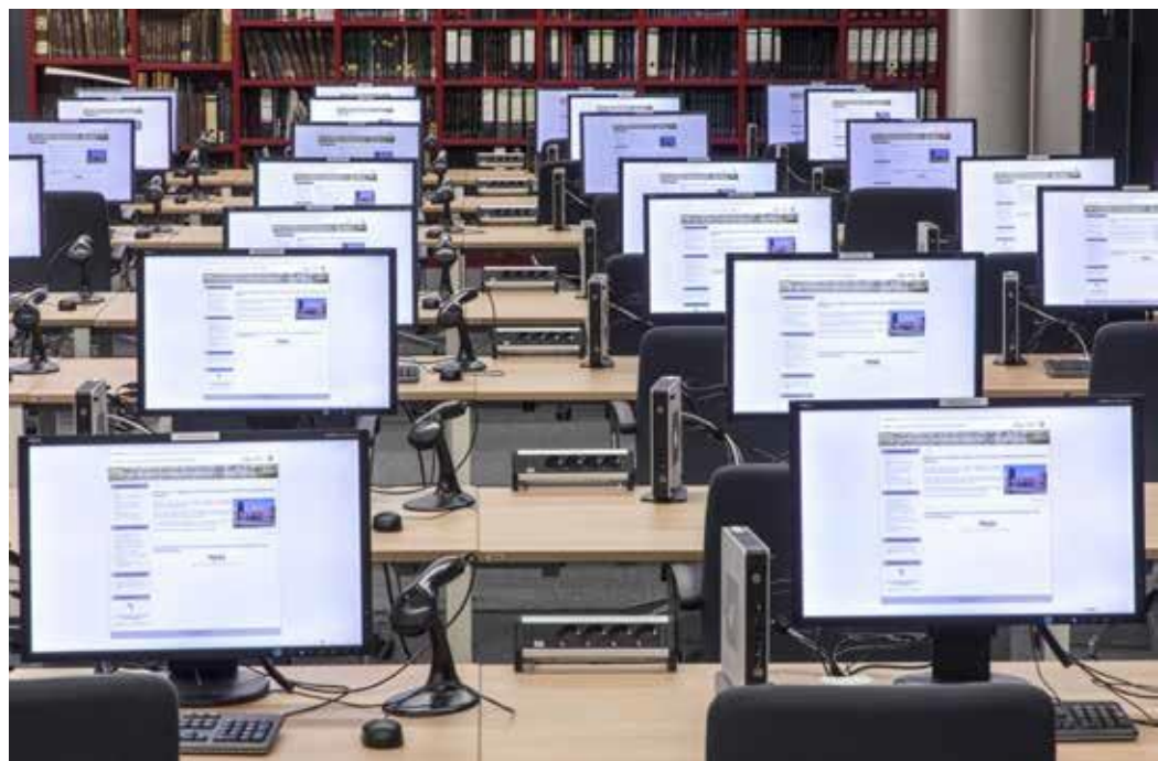
Die Lesesäle an unseren drei Standorten bieten unseren Nutzern eine moderne

Ist das Archivgut verzeichnet, kann es schließlich von den Bürgern genutzt werden. Es birgt eine Fülle von Informationen und dient daher als Quelle für die unterschiedlichsten historischen Fragestellungen. Dementsprechend vielfältig sind die gesellschaftlichen Gruppen, die aus unterschiedlichen Perspektiven darauf zugreifen: Privatpersonen, Heimat- und Familienforscher, Wissenschaftler, Studenten, Behördenmitarbeiter, Schüler, Journalisten und andere Kunden kommen zur Recherche und Einsichtnahme in die Archive. Das Personal des LAV stellt die Archivalien bereit, berät bei Recherchen und ist Vermittler historischer Bildungsarbeit. Auch Ihre Akten können auf diese Weise das kulturelle Erbe bereichern und einer Vielzahl interessierter Nutzer als Fenster in die Vergangenheit dienen.