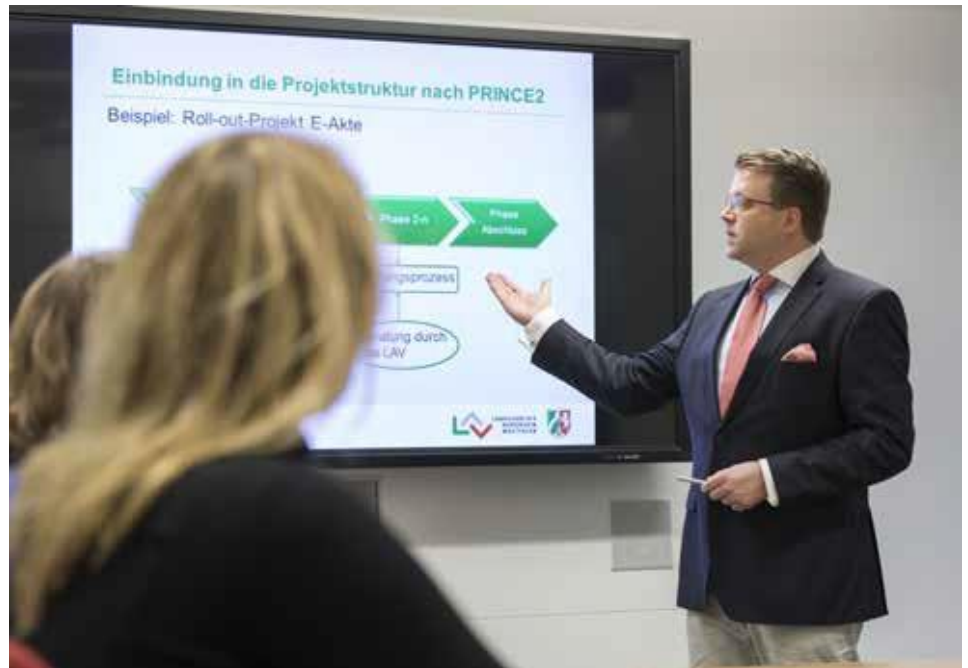
Insbesondere bei der Einführung der elektronischen Akte bietet das LAV NRW sich als kompetenter Ansprechpartner an.

festgelegten Schutzfristen für die Benutzung bereitgestellt. So kann auch Schriftgut Ihrer Behörde, mit dem Sie täglich arbeiten, später zu Archivgut und damit zu einem Teil unseres historischen Erbes werden. Die Bewertung der Unterlagen ist eine besonders wichtige Aufgabe, denn nicht alles kann dauerhaft verwahrt werden. Zum einen ist dies aus ökonomischen Gründen nicht vertretbar, würden doch die Mengen an Material und