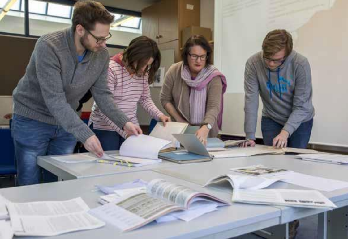
Eine Vielzahl an Angeboten für verschiedene Nutzergruppen macht das LAV NRW zu einem Ort historischer Bildung.