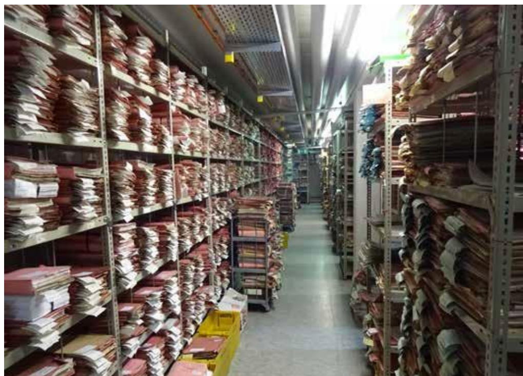
Aus den Unmengen an analog wie digital entstehenden Unterlagen muss eine Auswahl getroffen werden.

Aber welche Schriftstücke werden Archivgut? Als „archivwürdig“ im Sinne des Archivgesetzes NRW gelten Unterlagen, denen ein bleibender Wert für Wissenschaft und Forschung, historisch-politische Bildung, Gesetzgebung, Rechtsprechung, Institutionen oder Dritte zukommt. Über die jeweilige Archivwürdigkeit entscheiden die zuständigen Archivare unter fachlichen Gesichtspunkten.